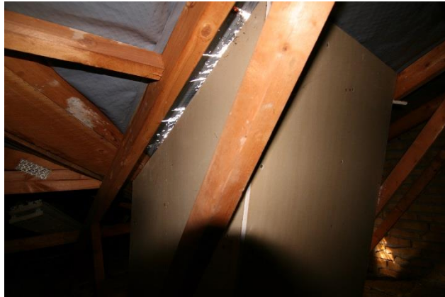
Defekt monarfol med revner omkring ovenlys