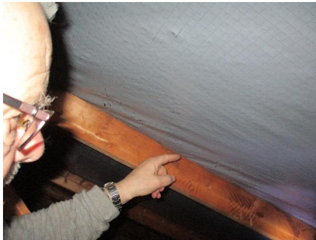
Defekt monarfol med revner