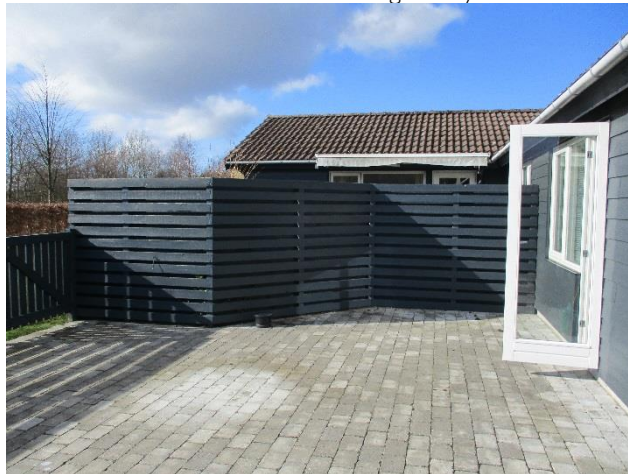
Betontagsten med stedvis mosdannelse